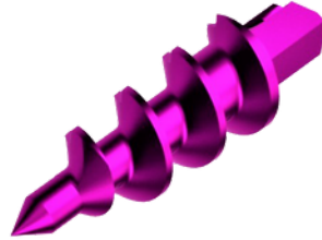
Âncora Rosqueada ANVISA 80062900011