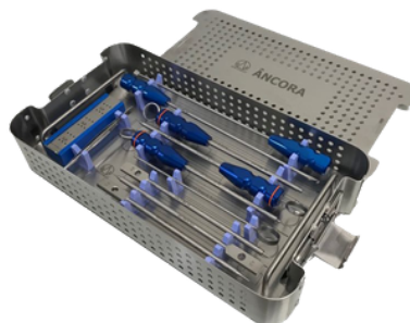
Instrumental Âncora Rosqueada em Titânio ANVISA 80062900013